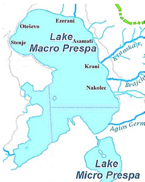
Slika 1. Istraživani lokaliteti sa Prespanskog jezera Figure 1. Researhed localities from Lake Prespa

Veliko Prespansko jezero (Lake Macro Prespa) je prekogranično jezero i nalazi se u jugozapadnom delu Republike Severne Makedonije. Nalazi se na nadmorskoj visini od 853 metra i ima površinu od 274 km 2 .